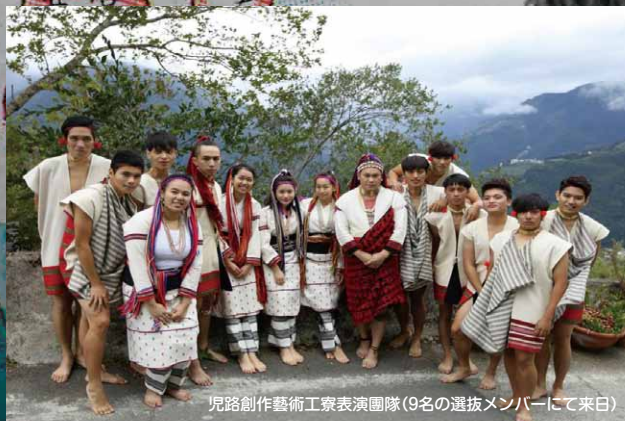
児路創作藝術工寮表演團隊(9名の選抜メンバーにて来日)