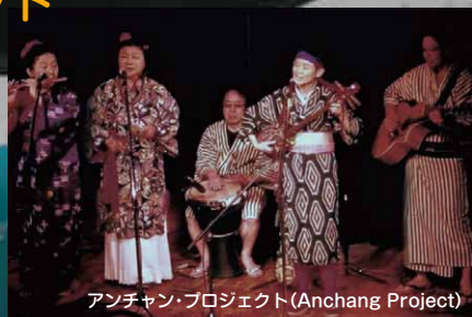
アンチャン・プロジェクト (Anchang Project)

東冬 侯温 MARUYOSHI-05 2500円+税 http://maruyoshi.adliv.jp/